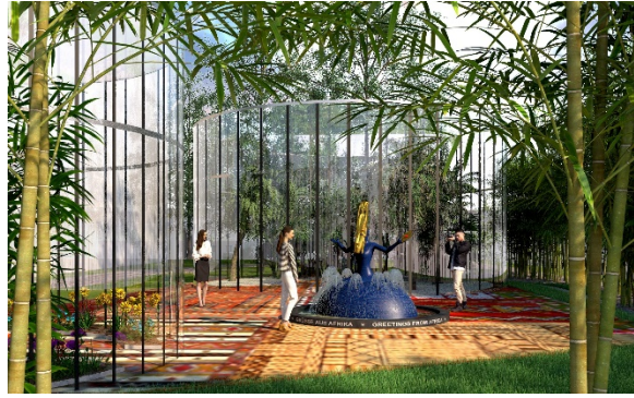
Gruß aus Marokko © Büro André Heller