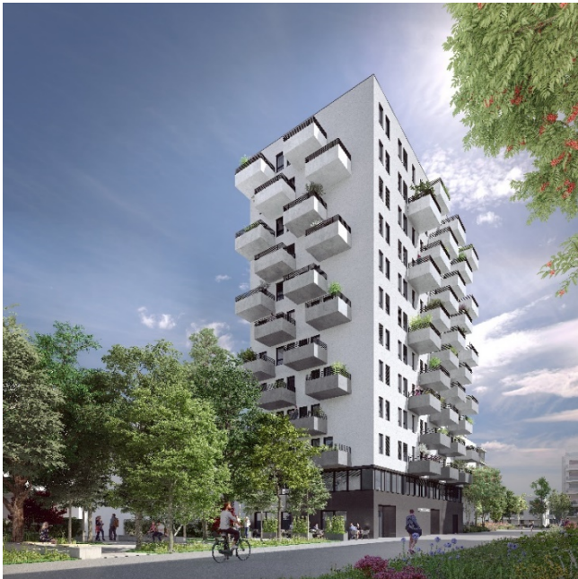
Bauteil 5