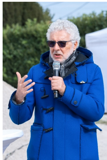
André Heller